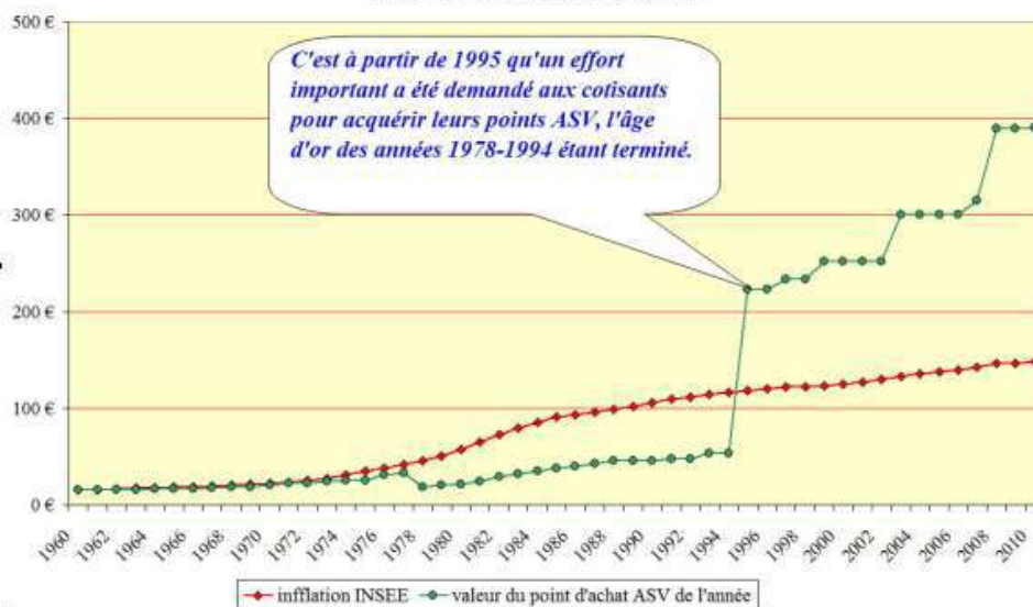
Evolution de la valeur d'achat du point ASV CARCD comparée à l'inflation depuis 1960

Cela représente une perte de 75 000 euros par an et par praticien à comparer avec l'effort des caisses pour nous maintenir dans cette convention 3376 € (2694€+ 682€) peut-on encore parler d'avantage social !!!