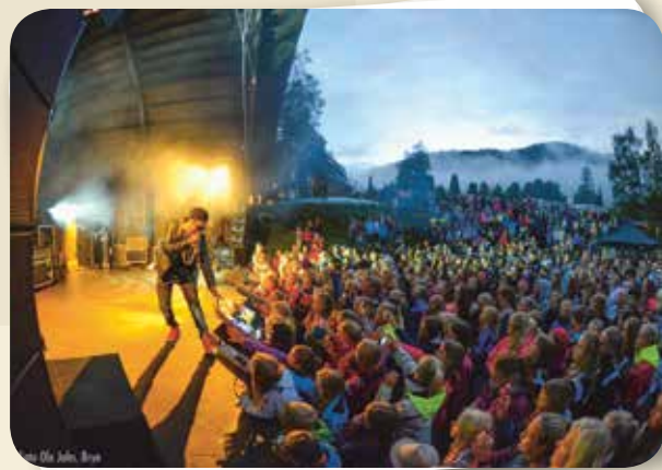
Opningsshow på Ål-cup fotball i Hallingdal Feriepark.

Sjå Ål sin arrangementskalender på www.al.no for oversikt over alt som skjer!