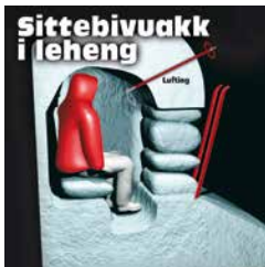
ILLUSTRASJON: IVAR GAASØ